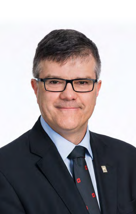
DENIS PELLETIER, pht